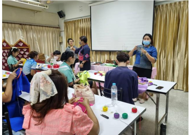
อบรมการปักสไบมอญให้แก่คุณครู