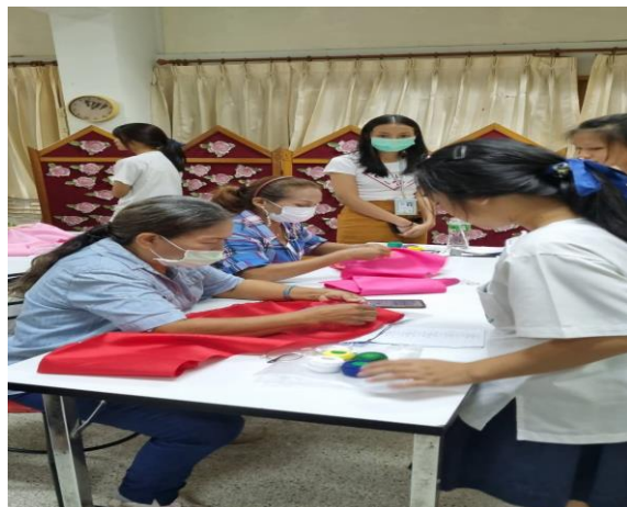
คุณครูและนักเรียนสอนชุมชน