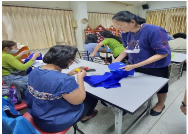
คุณครูและนักเรียนสอนชุมชน