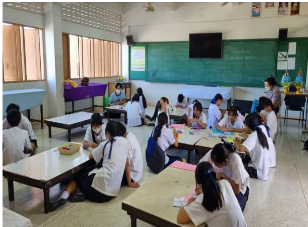
คุณครูอบรมการปักสไบมอญแก่นักเรียน