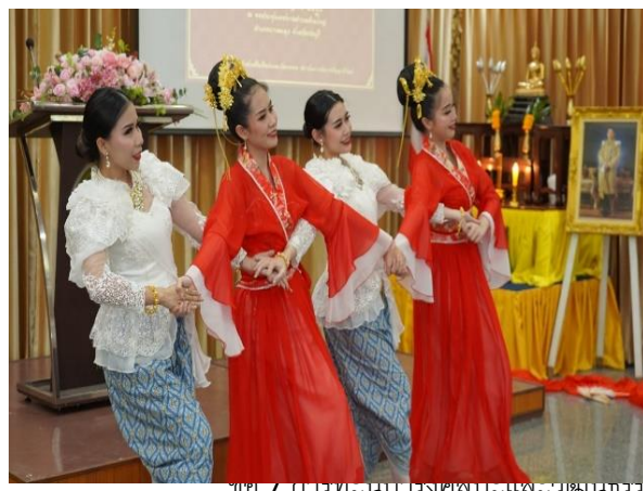
ภาพ / การทอดผ้า รุ่งศุภะและวัฒนธรรมรวม