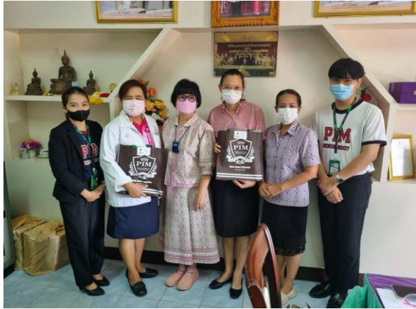
ประชุมกับผอ.โรงเรียนเพื่อวางแผนการจัดกิจกรรม